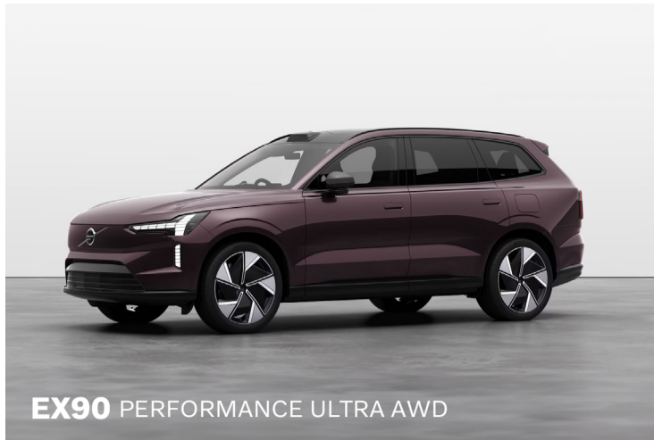
EX90 PERFORMANCE ULTRA AWD