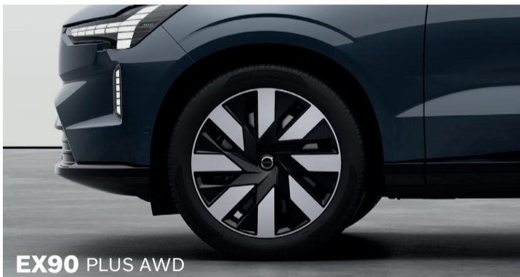
EX90 PLUS AWD