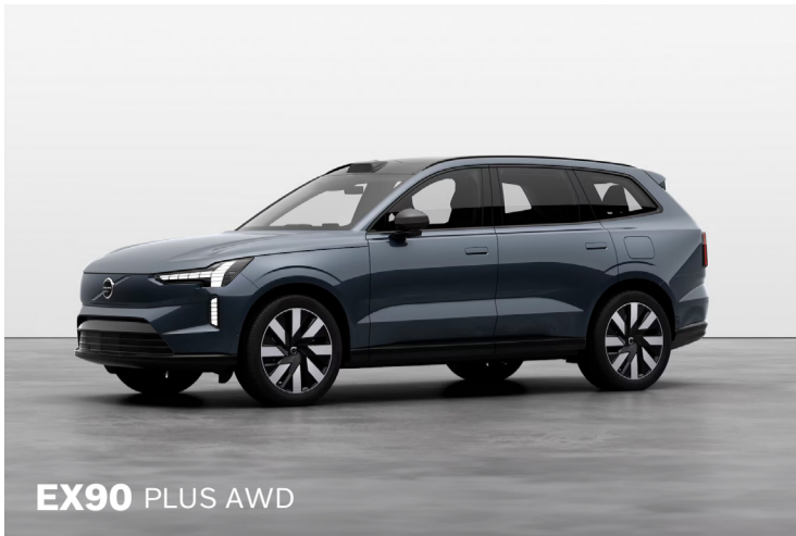
EX90 PLUS AWD