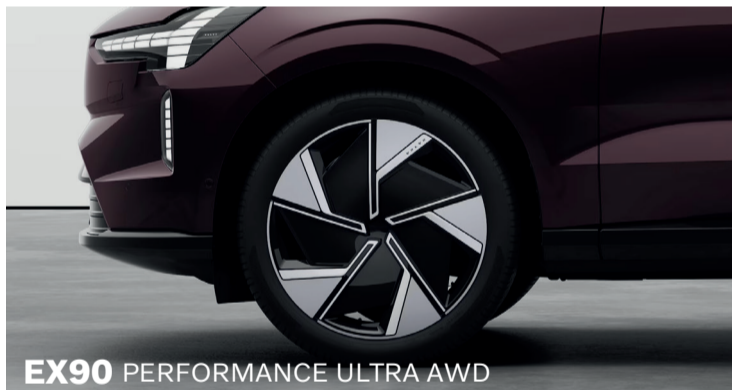
EX90 PERFORMANCE ULTRA AWD